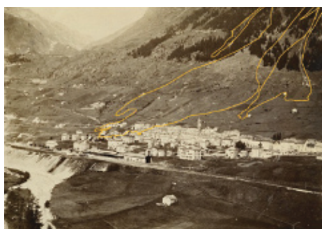
Photo de l'éboulement d'Airolo en 1898 (en haut). La zone de dépôt est marquée sur un cliché effectué avant l'événement (à gauche), puis reportée sur une carte pixelisée (en bas à droite) et une orthophoto (en bas à gauche).