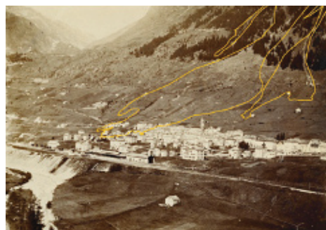
Vielgestaltiges Ereignis: Foto des Erdbebens bei Airolo von 1898 (oben). Daraus ist auf die Ablagerungszone vor dem Rutsch zu schliessen (links), die ferner auf eine aktuelle Pixelkarte (unten rechts) und eine Orthofoto (unten links) aufgetragen wird.